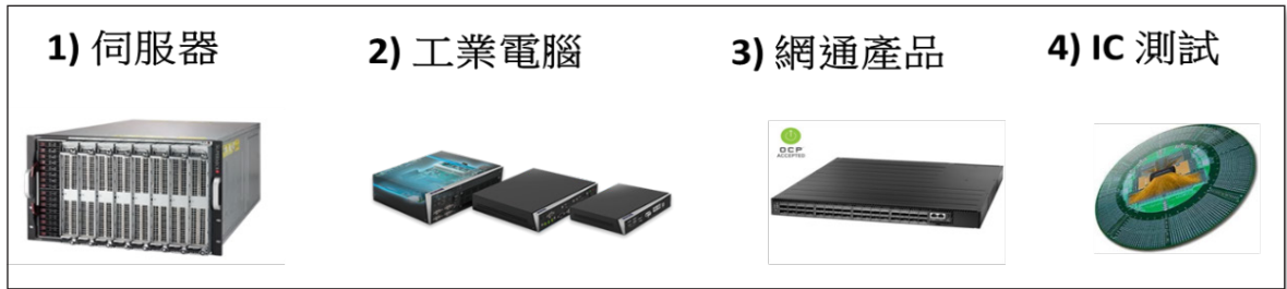
圖 02：博智主要產品類別