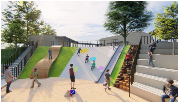
圖 6：3D 地景遊戲場

本館 108 年因鍾肇政文學館及鄧雨賢音樂館外移，致場館面臨轉型期，遂調整場館營運方向，規劃以親子作為本館目標族群，並用童趣視角進行場館改造，期將本館建置為具客家特色且適合親子同遊之館舍。