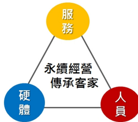
圖 8：服務、人員及硬體三大構面圖

(三) 整理品質管理系統 ：透過服務、人員及硬體三大構面，檢視並建立系統性優化服務品質架構。