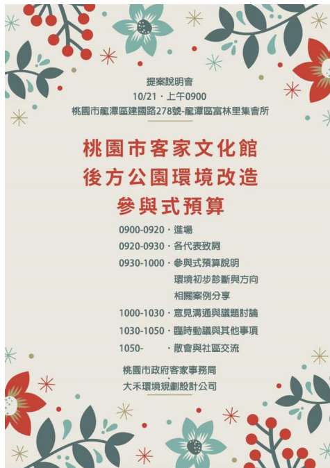
圖 1：客文館公園改造說明會