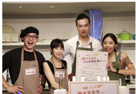
圖 3：2020 客家美食料理比賽網紅線上直播