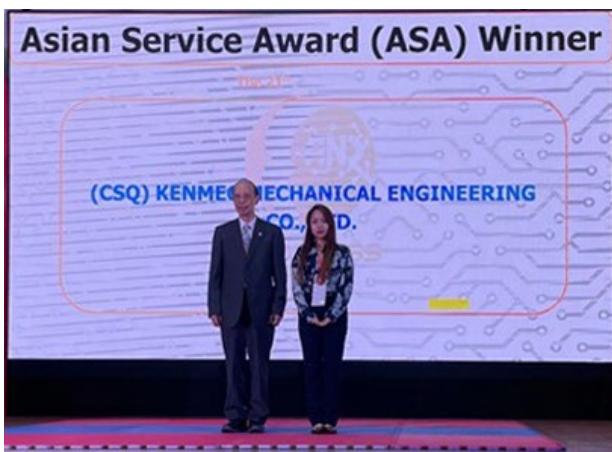
廣運機械工業獲頒ASA獎