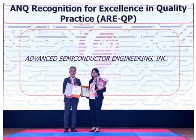
日月光半導體製造獲頒ARE-QP獎