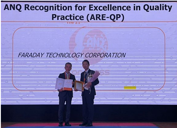
智原科技獲頒 ARE-QP 獎